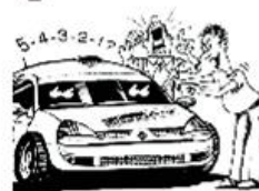
Halten Sie Start- und Zielräume frei!