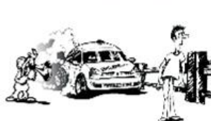
Befolgen Sie die Anweisungen der Funktionäre!