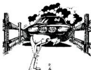
Betreten Sie keine gesperrten Strecken!