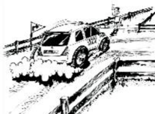
Auslaufzonen sind nur für Rallyeautos da!