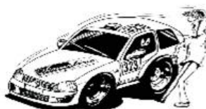
Wählen Sie einen sicheren Standort!