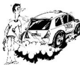
Rallyeautos werfen mit Steinen!

Seien Sie sich bewusst, dass bei Zuwiderhandlung ein Abbruch der Wertungsprüfung durch die Rallyeleitung jederzeit vorgenommen werden kann und muss.