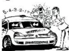
Halten Sie Start- und Zielräume frei!