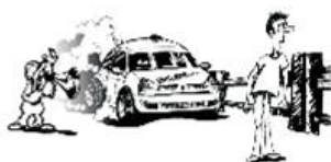
Befolgen Sie die Anweisungen der Funktionäre!