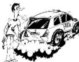
Rallyeautos werfen mit Steinen!

Seien Sie sich bewusst, dass bei Zuwiderhandlung ein Abbruch der Wertungsprüfung durch die Rallyeleitung jederzeit vorgenommen werden kann und muss.