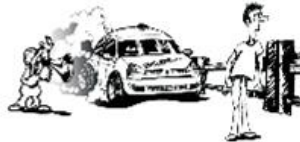
Befolgen Sie die Anweisungen der Funktionäre!