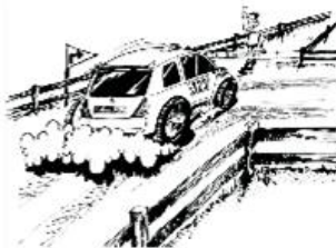
Auslaufzonen sind nur für Rallyeautos da!