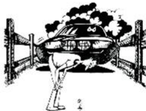
Betreten Sie keine gesperrten Strecken!