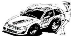
Wählen Sie einen sicheren Standort!