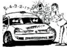
Halten Sie Start- und Zielräume frei!