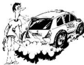
Rallyeautos werfen mit Steinen!

Seien Sie sich bewusst, dass bei Zuwiderhandlung ein Abbruch der Wertungsprüfung durch die Rallyeleitung jederzeit vorgenommen werden kann und muss.