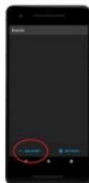
Main Screen when app is opened. Click "add event".

When you arrive and check in at the event, each car number will be given a unique code to enter into the app.