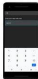
Enter unique code.