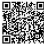
(Google Play Store)